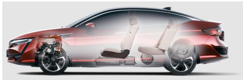
▶ 그림3. Honda Clarity 내부구조도